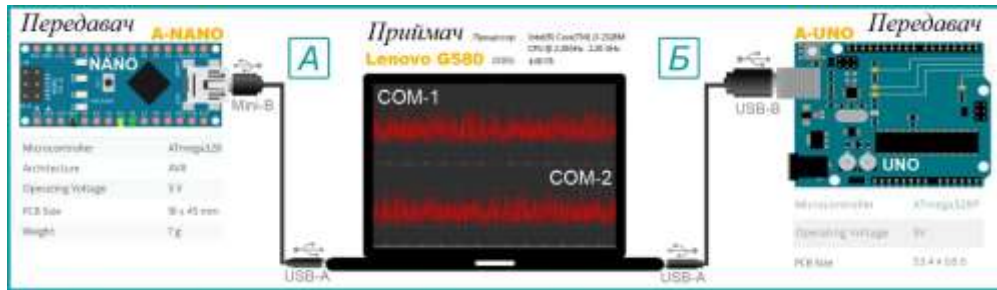
Рис. 1. Структурна схема макету передачі даних шумовими сигналами: (а) КЧМШС, (б) ФМШС

реалізованих алгоритмів передачі даних КЧМШС та ФМШС на платі Arduino Nano/UNO відповідно. Після підключення платформ до комп'ютера через USB порт розпочинається посилка даних.